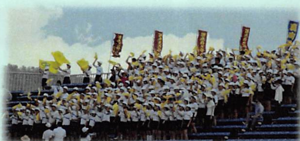
(山形県中学校駅伝競走大会 全校応援の様子)