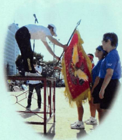
(FF 体育祭 優勝旗授与の様子)