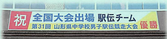
(平成 28 年度県中男子駅伝競走大会 優勝・全国大会出場記念看板)