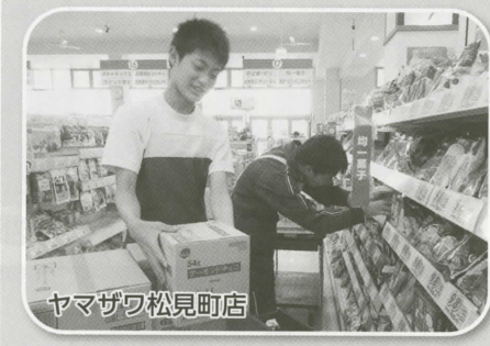
ヤマザワ松見町店