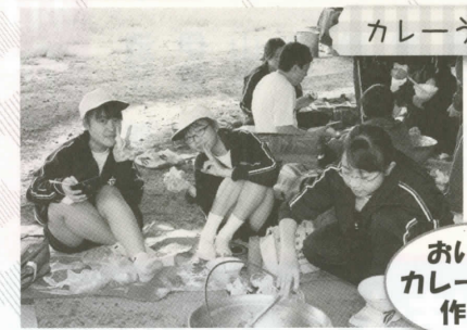
カレーうどん作り