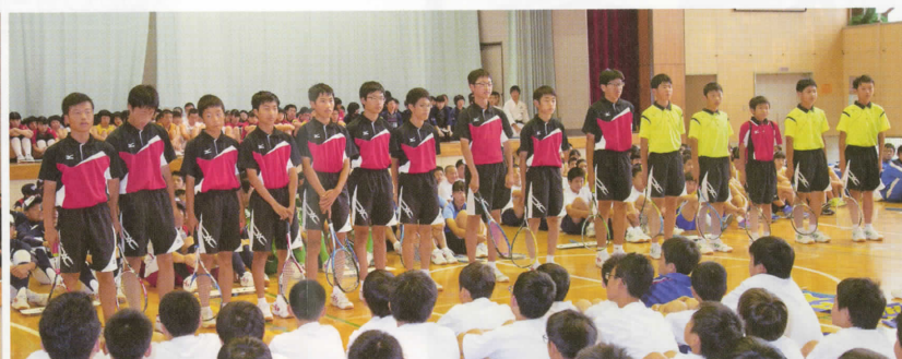
〈男子ソフトテニス部〉