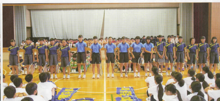
〈女子ソフトテニス部〉