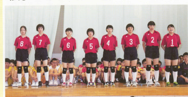
〈女子バレーボール部〉