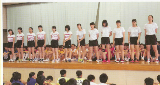
〈女子バドミントン部〉