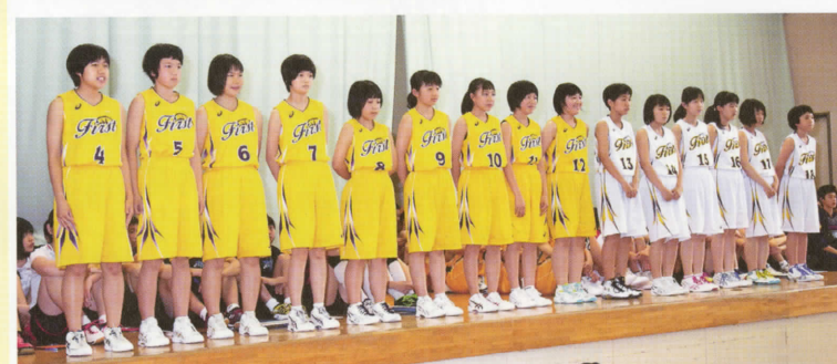
〈女子バスケットボール部〉