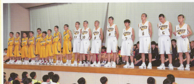
〈男子バスケットボール部〉