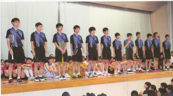
〈男子バドミントン部〉